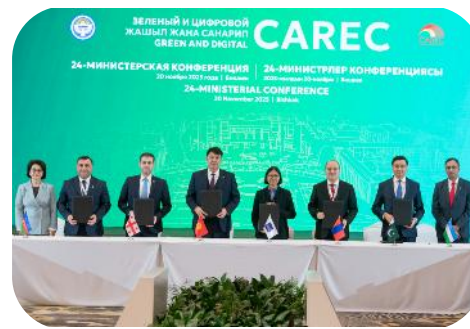
MOU on CAREC Regional Tourism Development