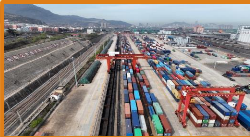
Китайско-казахстанский логистический центр, Ляньюньган