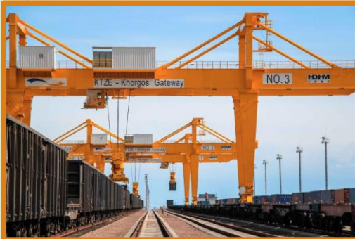
Сухой порт Хоргос