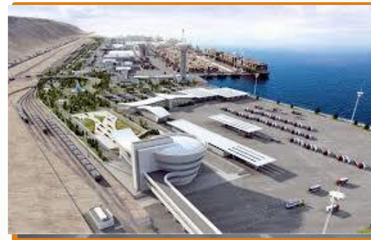
Ойбек - Фотехобод