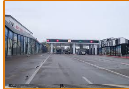
Ак Тилек - Карасу