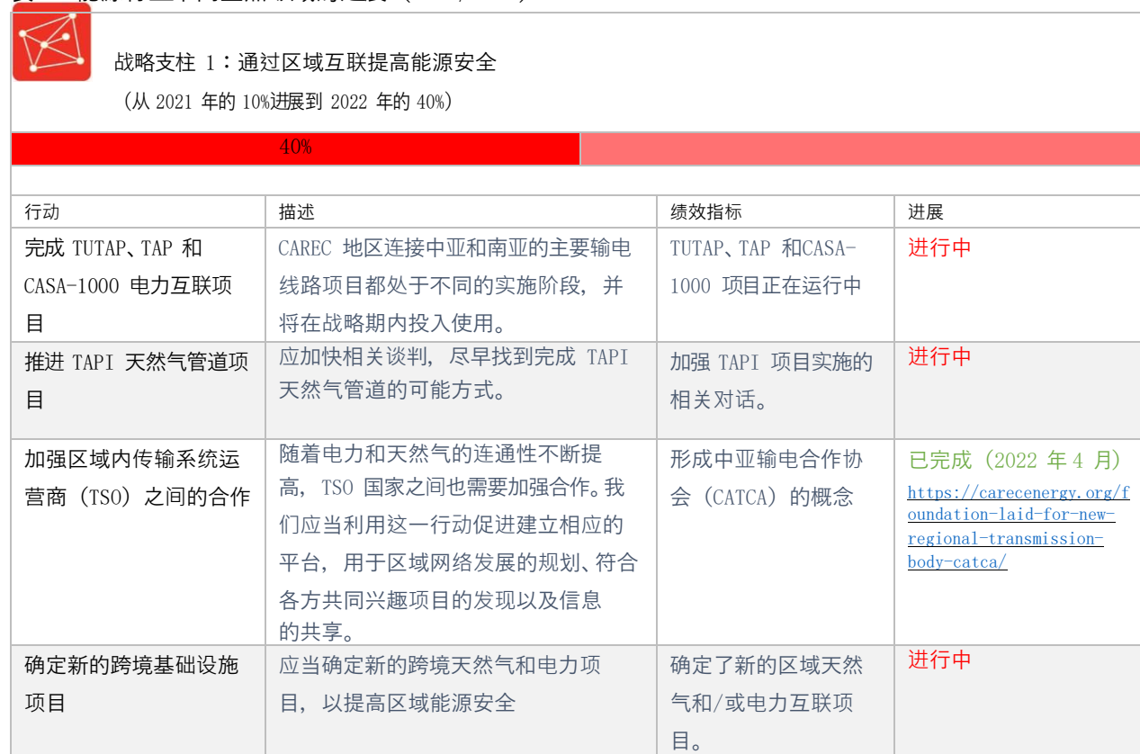
表 2：能源行业不同重点领域的进展（2021/2022）

在所有的战略支柱和跨领域主题下，各方就 CAREC 能源行业 2030 年工作计划，商定出了一份交付成果清单。下表展示了 2020-2030 年之间需要实施的所有行动，以及迄今为止所取得的进展。