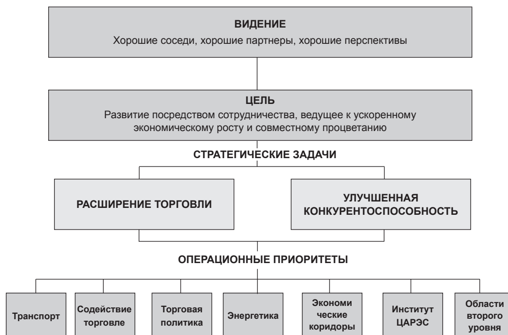
Рисунок 1: Стратегическая повестка Программы ЦАРЭС

Объединенных Наций, в течение десятилетия непрерывного сотрудничества валовой внутренний продукт во всей Центральной Азии увеличится на 50%. 24 Эти перспективные выгоды слишком значительны, чтобы их можно было игнорировать.