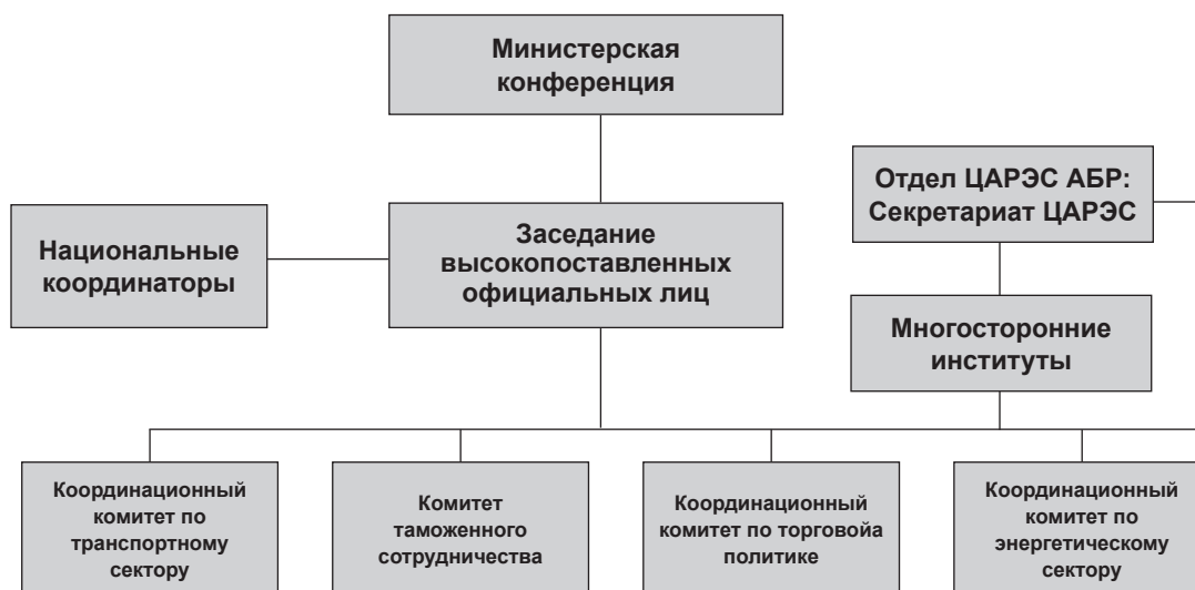
Рисунок 3: Общая институциональная структура