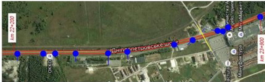
Picture no. 3.4.1: Road section at km 22+200 - km 23+900 with access road (blue color)

Определять недостатки до завершения проектов