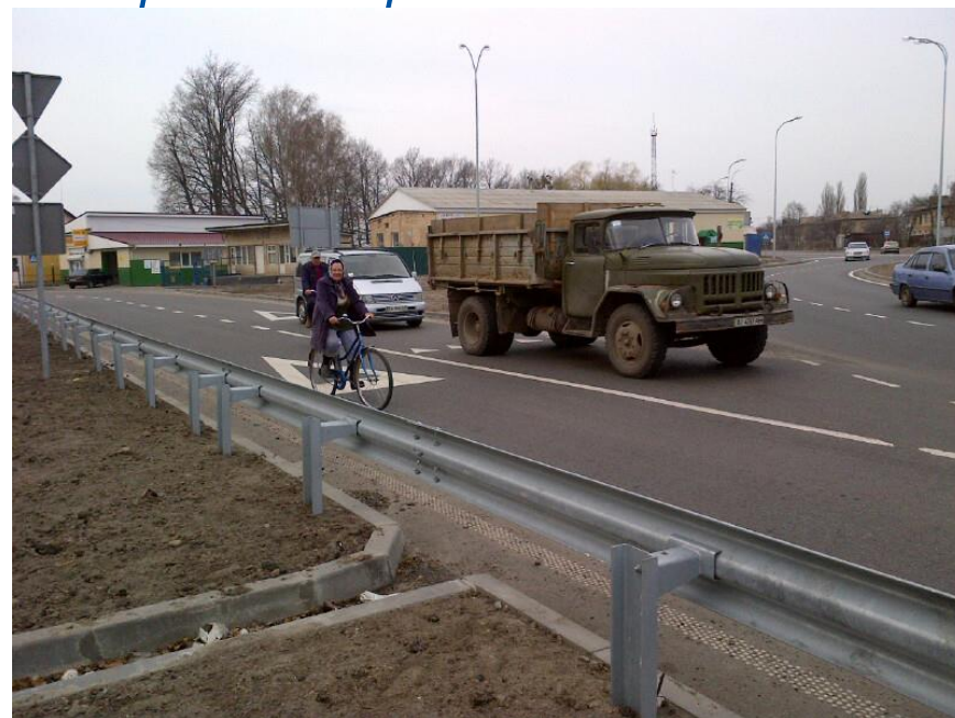
Динамические кольцевые развязки в городских районах, Отсутствие полос для велосипедистов