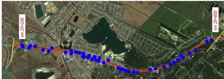
Picture no. 3.4.2: Road section at km 25+200 - km 28+600 with access road (blue color)