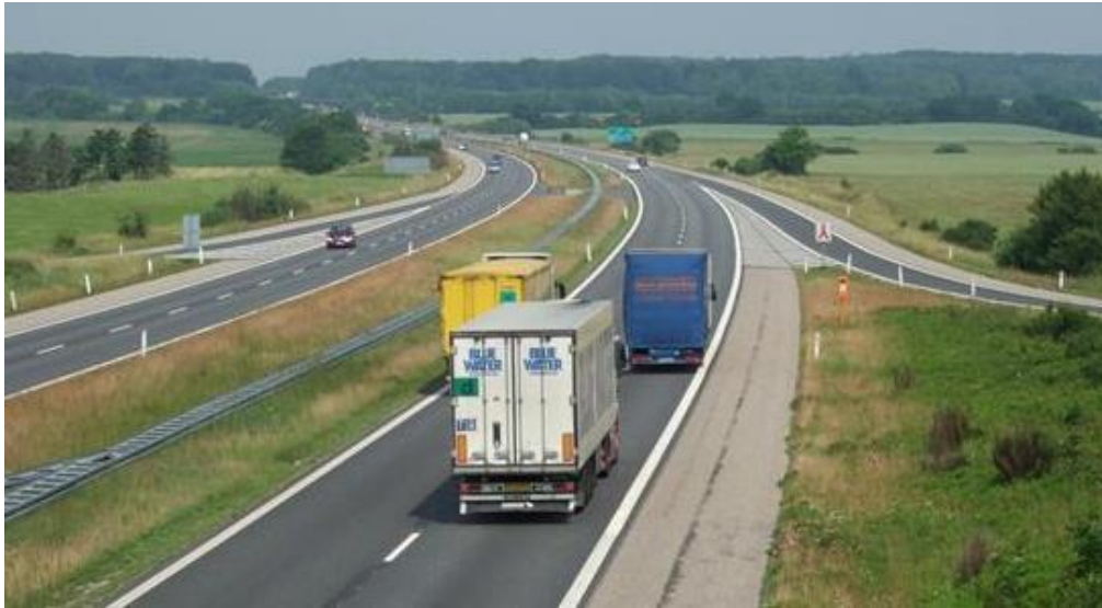
Эффективное разделение пользователей автодорог

Эффективно разделять или безопасно объединять