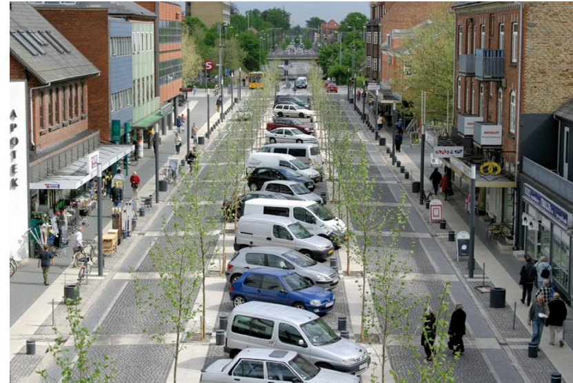
Безопасная интеграция пользователей автодорог