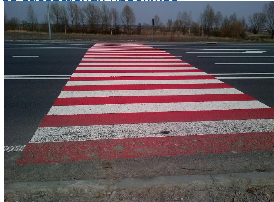
Небезопасный пешеходный переход