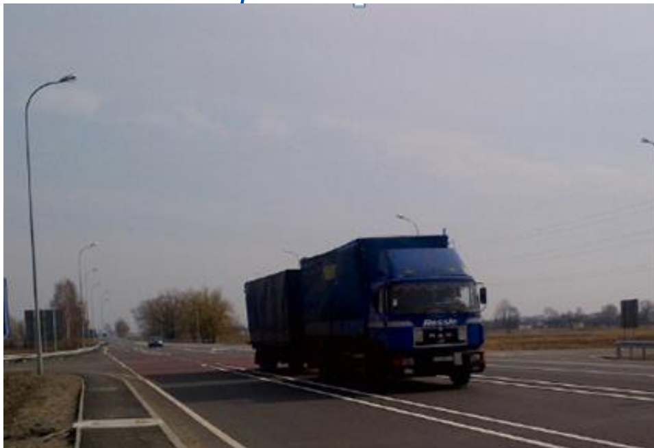
Четырехсторонние скрещения скоростных дорог

Определять недостатки до завершения проектов