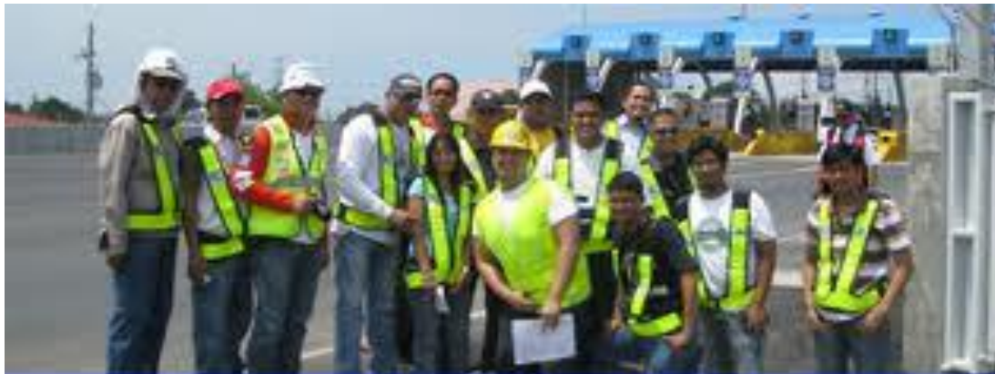
1 st Training Course on Road Safety Audit Conducted in cooperation with Manila North Tollways Corporation September 13-17, 2010