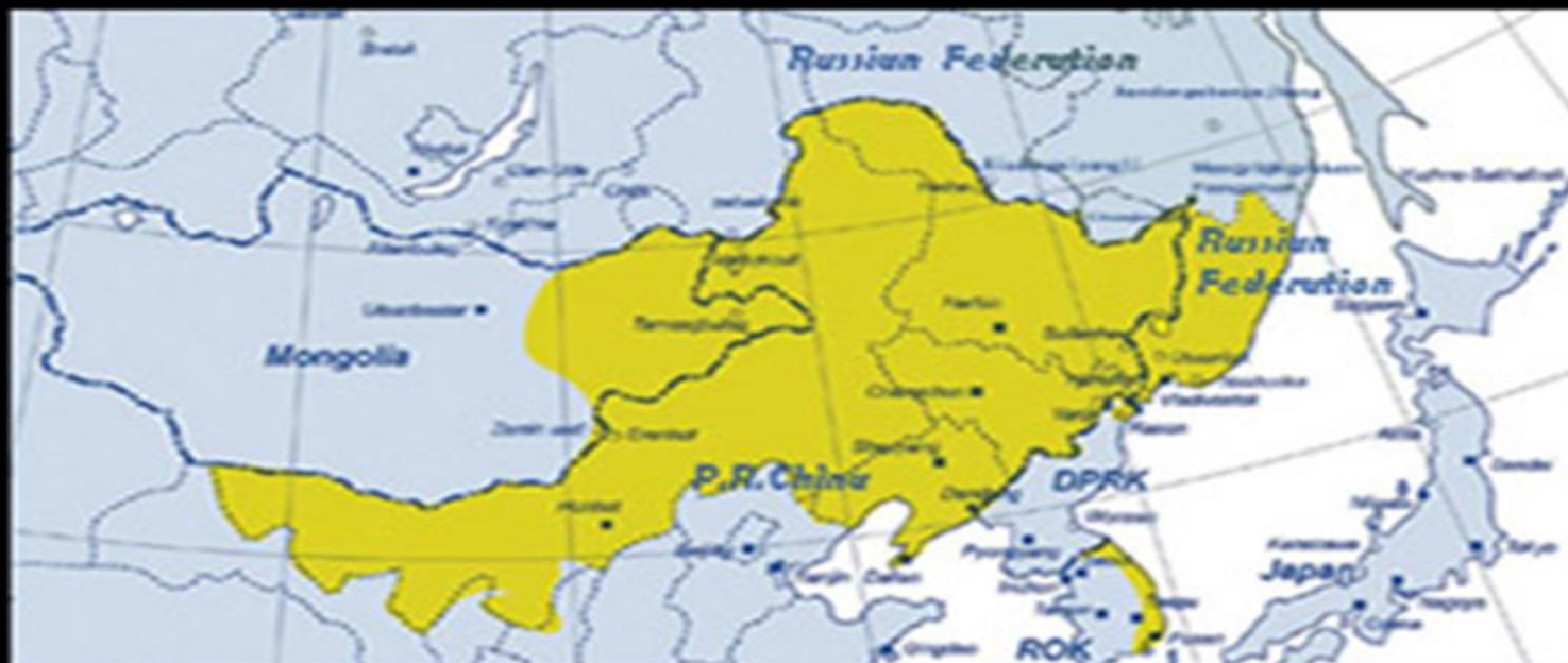
The Greater Tumen Region